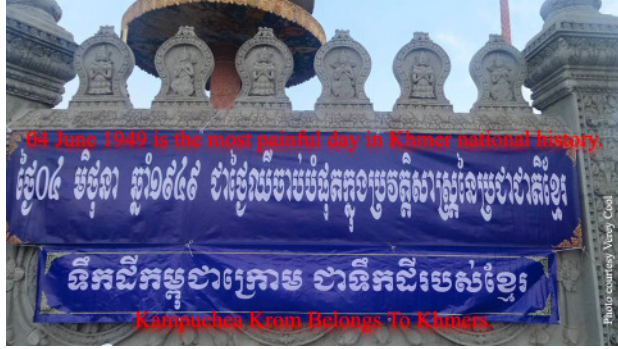
94 June 1949 is the most painful day in Khmer national history

ថ្ងៃទី០៤ មិថុនា ឆ្នាំ១៩៤៩ ជាថ្ងៃឈប់រប់ដុះកង្កែបប្រូតិស្តាស្ត្រូលីមូស៊ីនីយ៉ាតូនីខ្មែរ